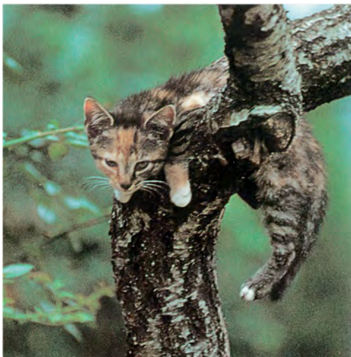
Een verwilde "puber" op avontuur

Met dit trieste feit eindig ik, om de volgende keer aandacht te schenken aan het groepsleven.