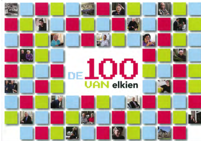
Infokaart de '100 van Elkien'

Elkien neemt hier nog een loopje met de geschiedenis. Op zich klopt het dat de Vereniging voor Volkshuisvesting in 1917 is opgericht, maar dat van de Hollanderhof 'het straatbeeld nagenoeg gelijk is gebleven' is onjuist, want deze 101 woningen zijn in de zeventiger jaren van de vorige eeuw afgebroken. Elkien verwacht de Hollanderhof met de Hollanderwijk. Deze laatste werd in 1915 gebouwd door de Woningvereniging Leeuwarden, die al was opgericht in 1905.