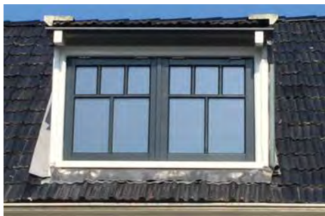
Nieuwe verdeling van de kozijnen in de dakkapel.

Naast Hollanderstraat 10 als modelwoning wordt op het moment van schrijven van dit stukje het dak in de Winsemiusstraat 7 voorzien van isolatie en nieuwe dakpannen. Spannend hoe dat er uit gaat zien!