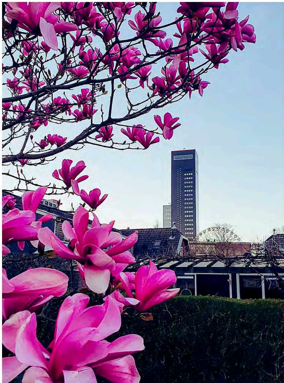
De tulpenboom op het pleintje in de Hollanderstraat.