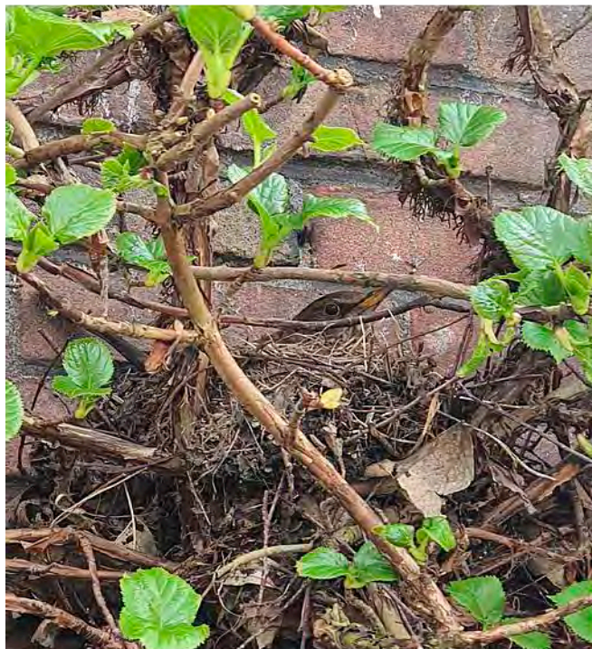
Een merel-nestje naast een voordeur ergens in de Hollanderwijk.