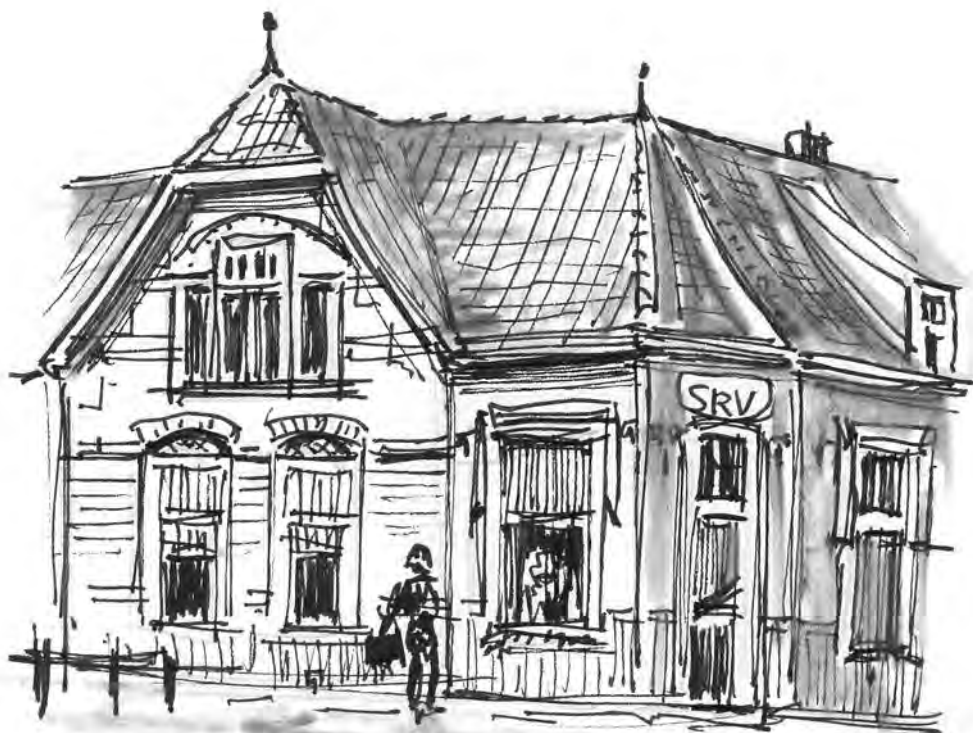
SASKIABLUURT VOORMALIG WINKELHOEKPAND