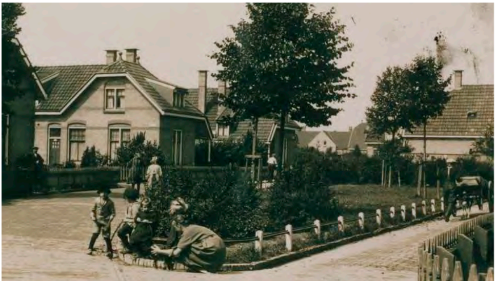
Boven het W.C. de Grootplantsoen, onder het pleintje in de Hollanderstraat in 1921.