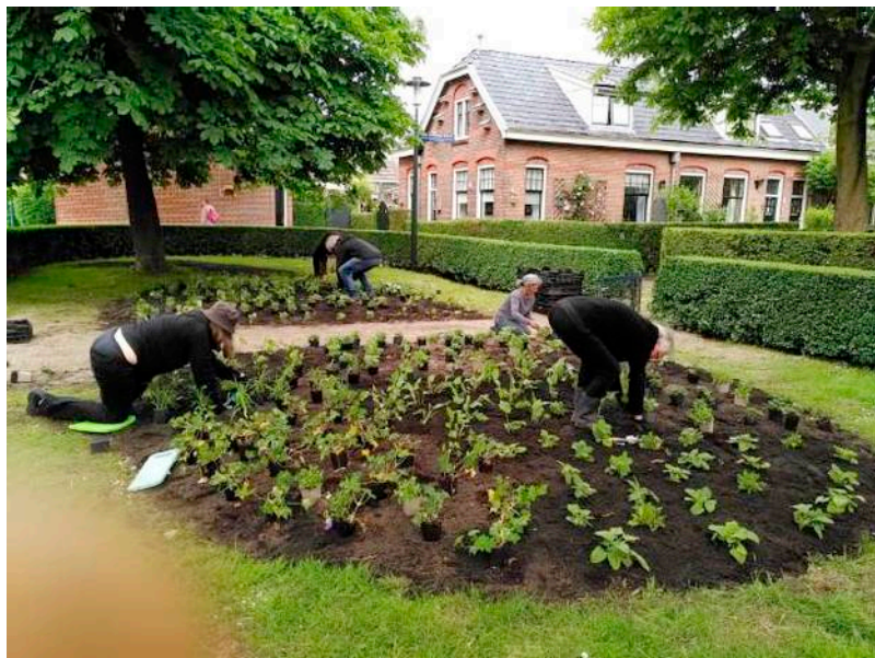
De plantploeg druk bezig.