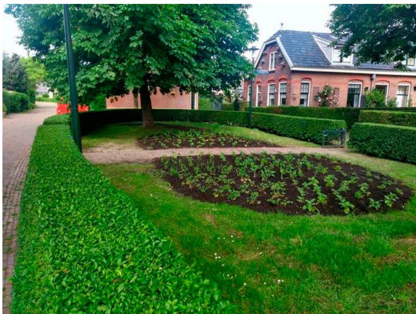
Daar ligt het dan, ONS PLANTSOEN