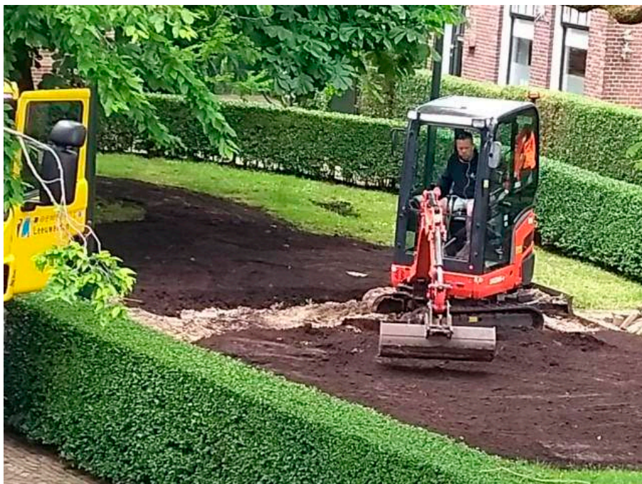
Bestrating eruit, grond erin.