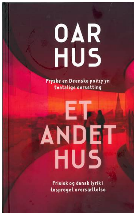
De voorkant van het Fries-Deense boek

Een bekende van Syds, de Friese dichter en fotograaf Geart Tigchelaar bezoekt al sinds 2015 vrienden in