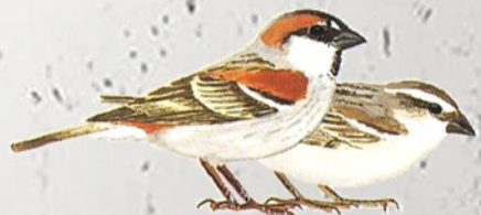
7. Kaapverdise mus