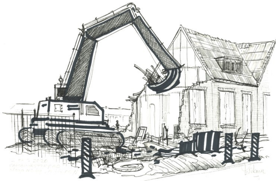
De sloop van woningen aan het Cambuursterpad

panden bij de Schoolstraat/ Willemskade met de ken- merkende rode diagonale versiering! En het oude Excelsior- pand aan de Olde Galileëen, werden vereeuwigd. Deze opsomming is niet volledig, maar de tentoonstelling is ongetwijfeld de moeite waard.