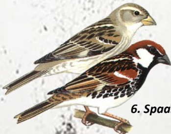
6. Spaanse mus