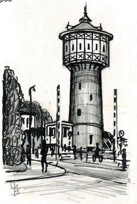
De watertoren bij de overweg

De tentoonstelling is van 26 juli tot 29 september te zien in Historisch Centrum Leeuwarden, Groeneweg 1.