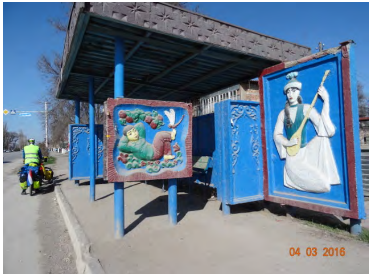
Een bushokje in kirgizie

We blijven niet lang in de hoofdstad. De grote gebouwen zijn imposant, de bouwstijl communistisch. Groot. Leeg. Taxi's proberen klanten te krijgen. Het busstation staat vol met mensen die een van de avondse bussen proberen te nemen naar hun bestemming. Chauffeurs leggen met elkaar een kaartje in hun vrije tijd. Gokken mag