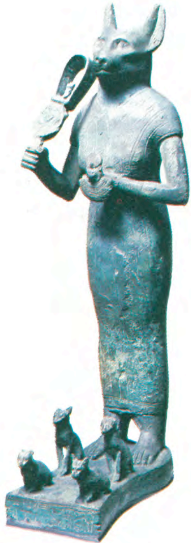
Godin Basta, met een kattenhoofd. Godin van het moederschap (Egypte 800 - 200 v Chr.)

Uiteraard braken er ook onder deze verwilderde katers gevechten uit. Het waren allemaal voormalige zwerfkatten, generaties die dus in het