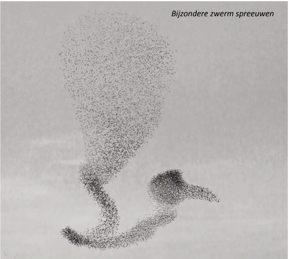
Bijzondere zwerm spreeuwen

Gezien het tijdstip leek het mij, dat ze begonnen aan hun derde broed, wat vrij normaal is. Helaas na 8 dagen waren ze verdwenen, terwijl het vrouwtje-Merel toch al een paar dagen op het nieuwe nest had gezeten. We zijn (voorzichtig) tot de