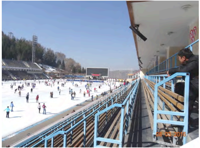
De schaatsbaan in Almaty

Al in Kazachstan ontmoeten we vaak mensen die ons op de foto willen zetten. We hebben op dat moment nog geen idee hoe vaak dat ons nog zal gaan gebeuren vooral in China. Maar over China vertel ik de volgende keer.