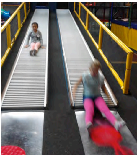
Actiefoto's van Aeolus!